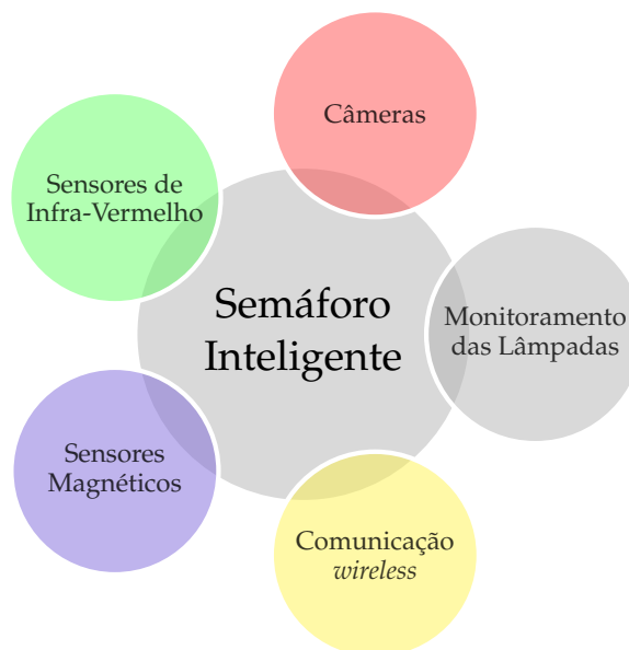
Figura 1 – Composição de um semáforo inteligente.

Nam dui ligula, fringilla a, euismod sodales, sollicitudin vel, wisi. Morbi auctor lorem non justo. Nam lacus libero, pretium at, lobortis vitae, ultricies et, tellus. Donec aliquet, tortor sed accumsan bibendum, erat ligula aliquet magna, vitae ornare odio metus a mi. Morbi ac orci et nisl hendrerit mollis. Suspendisse ut massa. Cras nec ante. Pellentesque a nulla. Cum sociis natoque penatibus et magnis dis parturient montes, nascetur ridiculus mus. Aliquam tincidunt urna. Nulla ullamcorper vestibulum turpis. Pellentesque cursus luctus mauris.